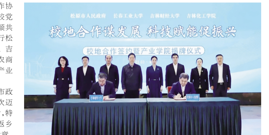
信本着优势互补、创新机制、共同发展、资源共享的合作宗旨, 政产学研用必将深度融合, 力争在实现财政税收、普惠金融、营商环境、冰雪经济、绿色康养、数字经济、电商产业、乡村振兴、生态旅游等方面共同组建研究、研学基地, 为“一市、一地、一城”高质量发展增智、聚势、赋能, 共同为在中国式现代化进程中为推动吉林全面振兴取得新突破贡献智慧和力量。

头企业签署共建产业学院合作协议。松原市委书记李晓杰与校党委书记孙杰光、副校长马秀颖共同为吉林财经大学与松原市人民政府、农业银行松原分行、吉林银行松原分行、郭尔罗斯农商银行、阳光村镇银行共建的产业学院揭牌、授牌。孙杰光首先对松原市委、市政府为推动双方合作向更深层次迈进给予的支持和帮助表示衷心感谢, 特别是疫情防控期间学生离校返乡过程中给予的帮助表达深深谢意。他表示, 这次双方签订系列务实合作协议, 是深入贯彻落实习近平总书记关于教育的重要论述和视察吉林重要讲话重要指示批示精神, 落实省委“一主六双”高质量发展战略, 落实就业优先战略和教育强省、人才强省战略的重要举措, 相信本着优势互补、创新机制、共同发展、资源共享的合作宗旨, 政产学研用必将深度融合, 力争在实现财政税收、普惠金融、营商环境、冰雪经济、绿色康养、数字经济、电商产业、乡村振兴、生态旅游等方面