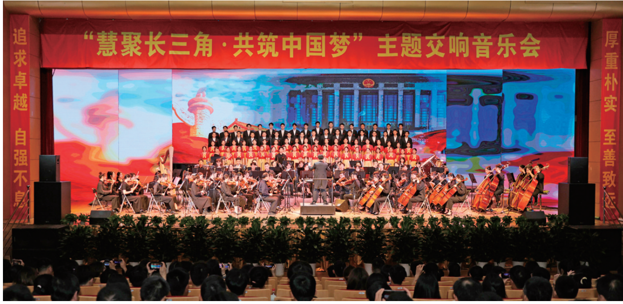
“慧聚长三角·共筑中国梦”主题交响音乐会

烈的其他问题,建立问题清单,做到真正把问题搞清楚。要狠抓问题整改,凡是能够解决的问题要立即着手解决,短期内不能解决的要系统谋划,确保真改、实改、改到位,常态化开展“我为师生办实事”活动。要注重建章立制,深入研究问题背后的根源,举一反三,补齐短板,建立健全一套打基础、管长远、治根本的现代大学制度体系,不断提高学校内部治理水平和管理服务质量。(文/学校办公室)